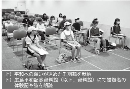
上) 平和への願いが込められた千羽鶴を献納 下) 広島平和記念資料館(以下、資料館)にて被爆者の体験記や詩を朗読