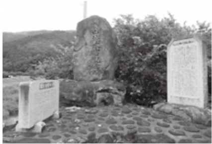
南山城水害記念碑 (旧後場西側の荒木橋、本町橋に建っています) 月4日(月) 場所 総合文化センター2階ギャラリー